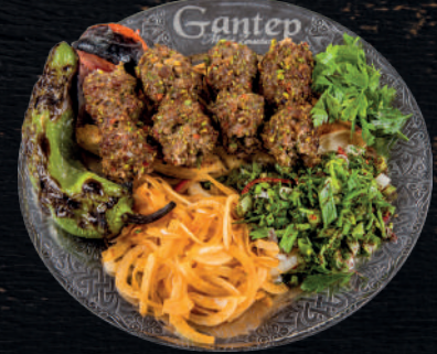
ANTEP FISTIKLI KEBAP