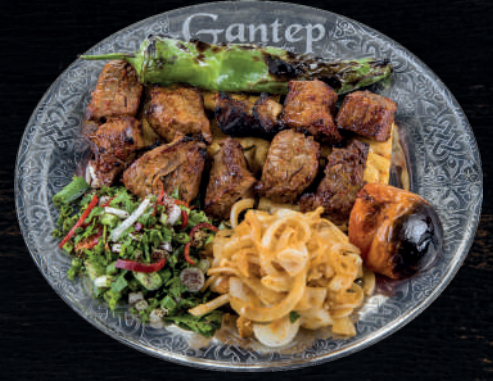
ANTEP TEBBIYELİ KUŞBAŞI