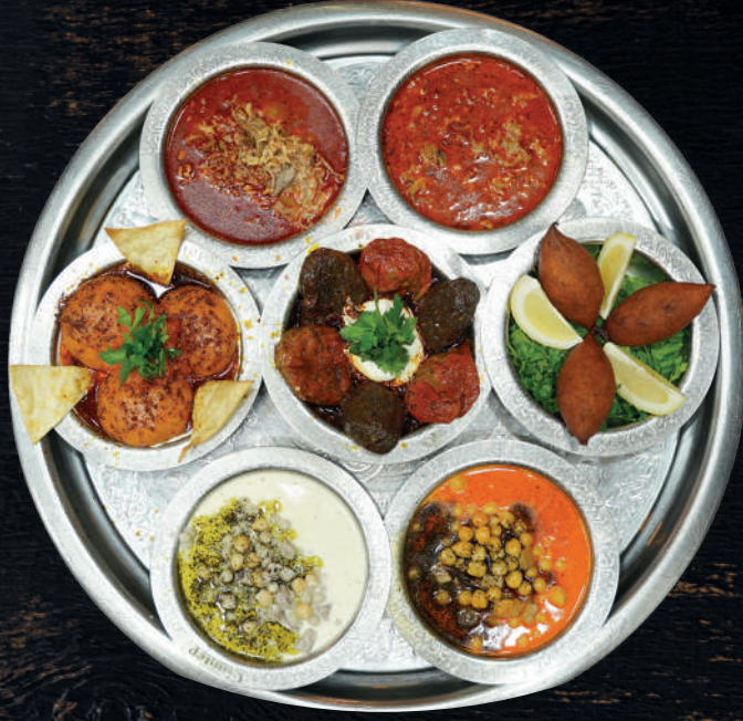
GANTEP YÖRESEL TEPŞİ (4-5 KİŞİLİK)