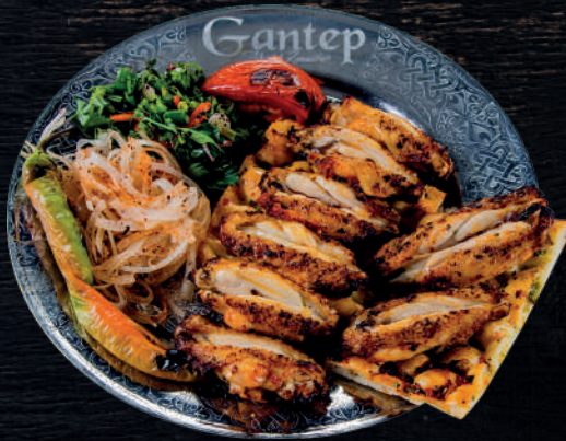
ÖZEL SOSLU KANAT