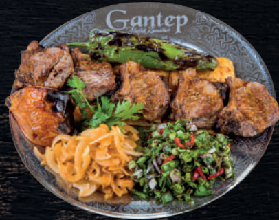
KEMİKLİ ANTEP PİRZOLA