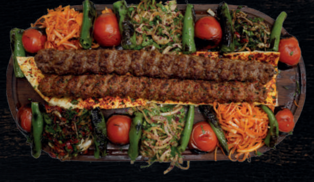
ZEBZELİ VE SADECE ÖZEL ZIRH KEBABI (2 KİŞİLİK)