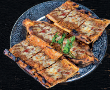
KIYMALI KAŞARLI PİDE