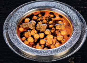
EKŞİLİ UFAK KÖFTE