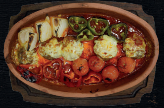
GÜVEÇTE SOSLU VE KAŞARLI KÖFTE