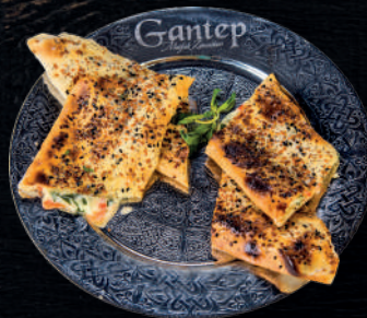
ANTEP PEYNİRLİ BÖREK