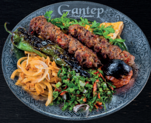
SADE ZIRH KIYMA