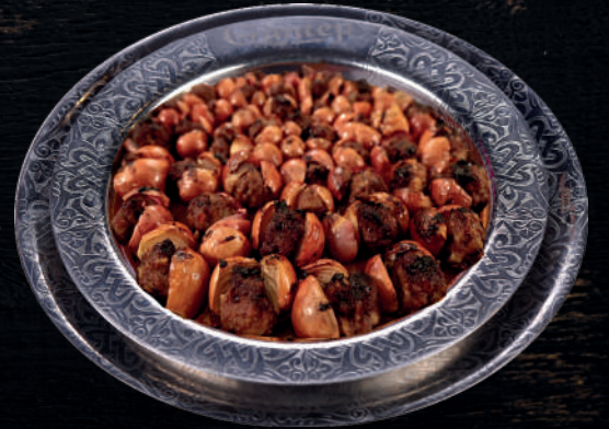
SOĞAN KEBABI (40 DAKİKA)