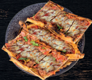
KUŞBAŞI KAŞARLI PİDE