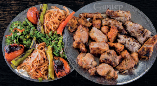
DUBLE ET TABAĞI