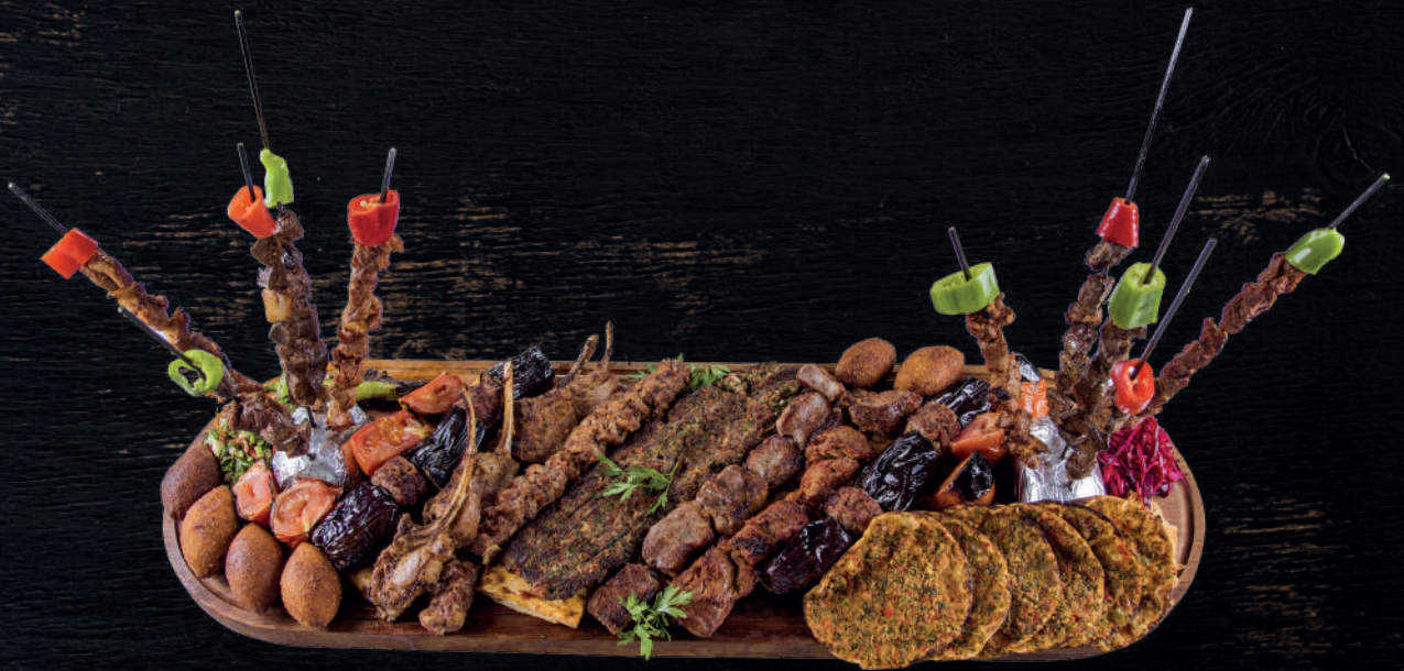
ALTI KİŞİLİK KARIŞIK KEBAP (9 PORSİYON KEBAP, 6 FINDIK LAHMACUN, 6 İÇLİ KÖFTE)