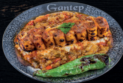
IZGARADA ÖZEL SOSLU BEYTİ SARMA