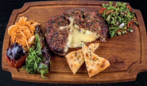
SEBZELİ KAŞARLI KÖFTE