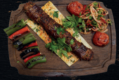
İKİ YÜZLÜ KEBAP