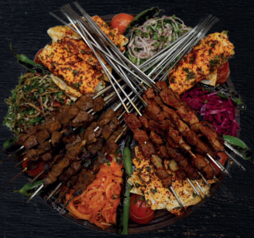
KARIŞIK ŞİŞ TABAĞI (3 KİŞİLİK)