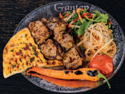
BÖBREK YATAĞI ETİ