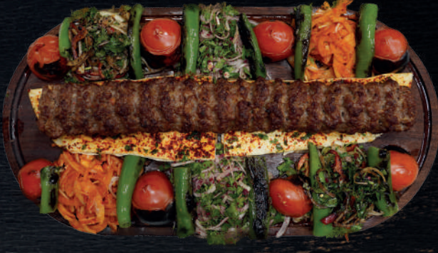
KILIÇ KEBABI (2 KİŞİLİK)