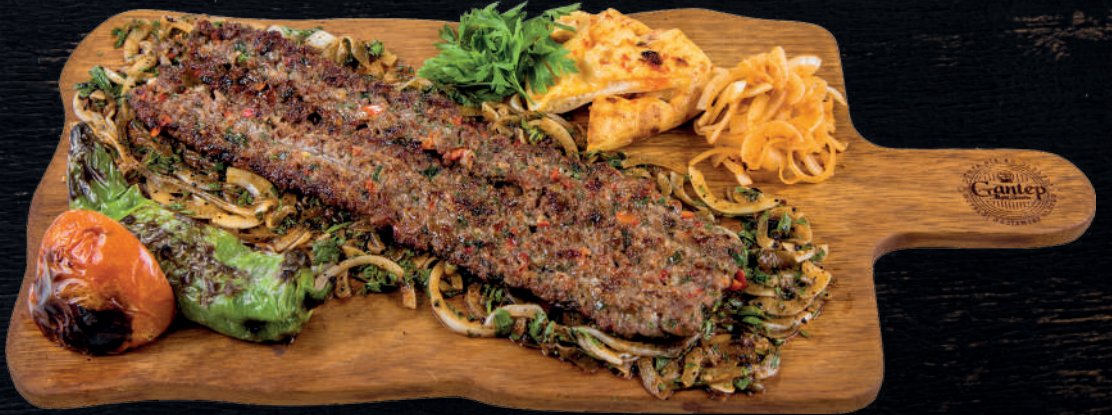
SEBZELİ AÇMA BEYTİ