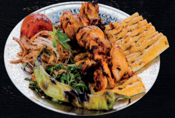
KEMİKSİZ SARMA TAVUK