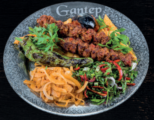
ACILI ZIRH KIYMA