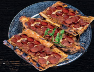
KAŞARLI SUCUKLU YUMURTALI PİDE