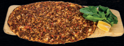
SOĞANLI İSOTLU LAHMACUN