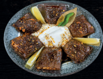
KURU PATLICAN DOLMA