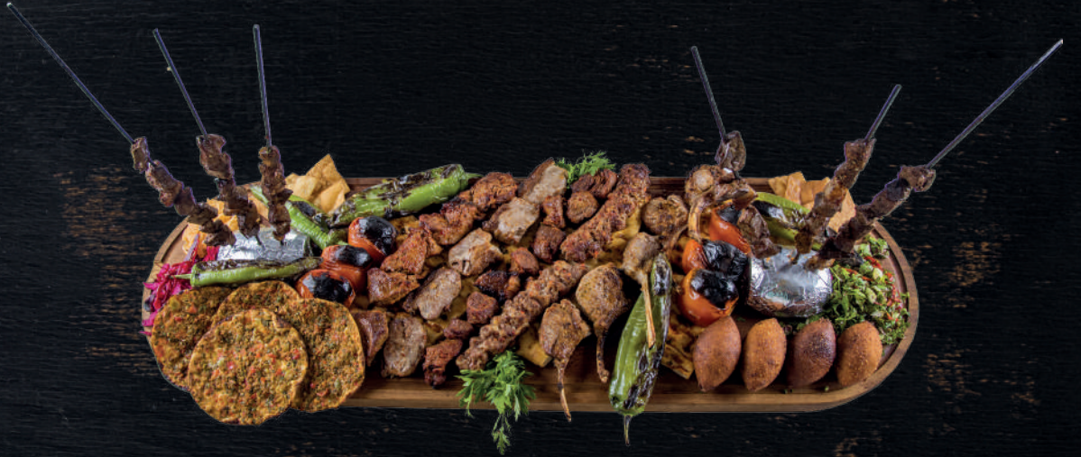
DÖRT KİŞİLİK KARIŞIK KEBAP (6 PORSİYON KEBAP, 4 FINDIK LAHMACUN, 4 İÇLİ KÖFTE)