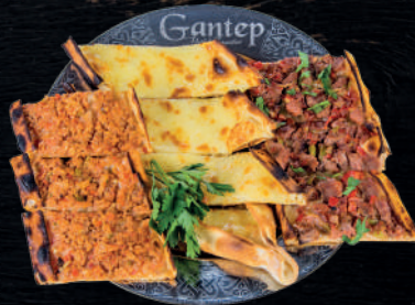
ÖZEL KARIŞIK PİDE