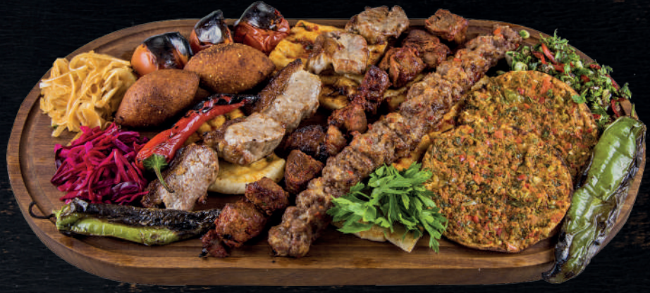
İKİ KİŞİLİK KARIŞIK KEBAP (3 PORSİYON KEBAP, 2 FINDIK LAHMACUN, 2 İÇLİ KÖFTE)