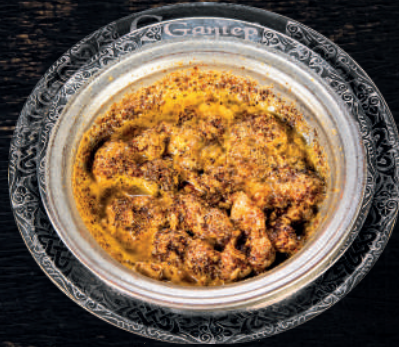
BEYİN VE YANAK KAVURMA