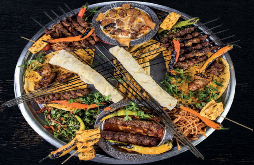
GALAALTI TEPŞİ (4-5 KİŞİLİK)