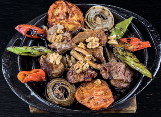
TEREYAĞ TAVADA ET ÇEŞİTLERİ